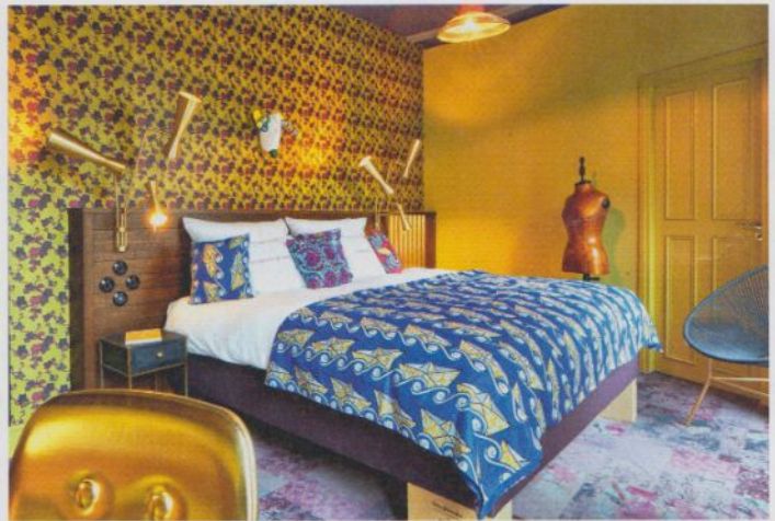
25 HOURS HOTEL TERMINUS NORD Das Design spiegelt die bunte Nachbarschaft des 10. Arrondissements wider.