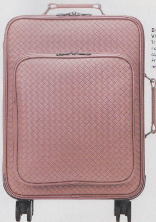
BOTTEGA VENETA Trolley in Altrosa aus Intrecciato-Leder, Fr. 4220,-, über mytheresa.com .